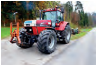
3162170 Case IH Magnum 7210

BJ 2003, SERCO, Tel. +41 (0)58 4340712, gmc@sercolandtechnik.ch, Ballenauswerfer, Elektronische Überwachung, Knoter Reinigungsgebläse, PickUp-Stützrad