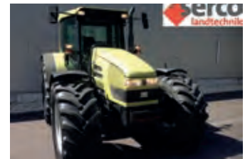
3093591 Hürlimann XT 913

42.000 CHF, SERCO, Tel. +41 (0)58 4340712, gmc@sercolandtechnik.ch, Druckluftbremse