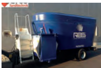
3093564 RBS Ares 2-14 (Mutti)

BJ 2010, 32.800 CHF, SERCO, Tel. +41 (0)58 4340712, gmc@sercolandtechnik.ch, Beleuchtung, Bordcomputer, Hydraulische Transportklappung, Höhenverstellung