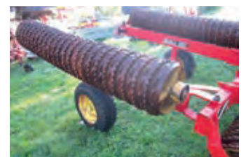
3159632 Väderstad Rollex RX 760

BJ 2016, 15.058 CHF, Direkter Draht: +41(0) 79 420 7568, Arbeitsbreite 2.1 m, Einstichtiefe max. 400 mm, Gewicht 1.375 kg