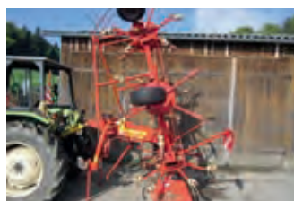
3005566 Niemeyer HR 671 DN

7.800 CHF, Tel. +41 (0)21 8610666, jean-michel.roch@hotmail.ch