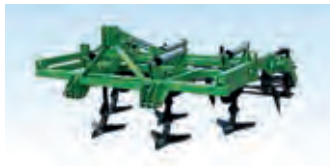
2321188 Bomet - Bangerter G 3000

3.800 CHF, Niederhauser Landmaschinen AG, Tel. +41 (0)62 9652020, niederhauser.landmaschinen@gmx.ch, Doppelherzschar, Flügelscharzinken, Stabwalzenkrümmer