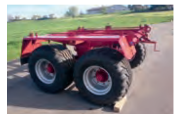
2933585 Pöttinger Tandemfahrwerk

3.450 CHF, Niederhauser Landmaschinen AG, Tel. +41 (0)62 9652020, niederhauser.landmaschinen@gmx.ch, 6,70 Meter Arbeitsbreite, 6 Kreisel mit je 6 Zinkenarmen