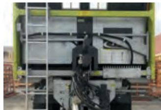
3093597 Fliegl ASW 261

BJ 2014, 2.250 €, Bangerter-Gisleren, Tel. +41 (0)32 3845035, rol.bangerter@bluewin.ch, Elektromotor, Körner Schleusegebläse, 7.5KW Gebläsemotor