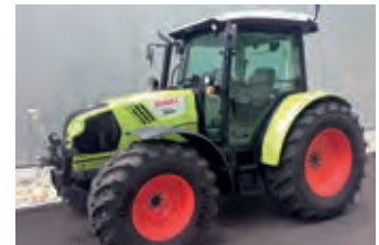
3093601 Claas Atos 350

BJ 1997, 1.076 CHF, Tel. +41 (0)79 2162975, josefvoegeli@hotmail.com, Magnum 7250 in Teilen: Tank, Kabinen-Dach, Vorderachs-träger