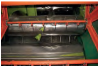
2452396 Claas Schneidwerk 4,50m

BJ 2015, 300 h, 74.000 CHF, SERCO, Tel. +41 (0)58 4340712, gmc@sercolandtechnik.ch, Allrad, EHR, Frontzapfwelle, Hydraulische Anhängerbremse