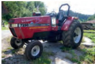
3162175 Case IH Magnum 7250

BJ 1997, 5550 h, 32.368 CHF, Tel. +41 (0)79 2162975, josefvoegeli@hotmail.com, Allrad, Druckluftbremsanlage, EHR, Fronthubwerk, Hydraulische Anhängerbremse