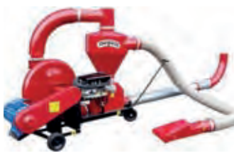
2184592 POM Bangerter T207

BJ 2002, 9.262 CHF, Meier Maschinen AG, Tel. +41 (0)52 3054242, werner.winkler@hm-maschinen.ch, Ährenheber, Klappschneidwerk mit Auto-Contur