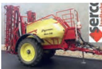
3093584 Rau Ikarus

2.259 CHF, Kurmann Technik AG, Tel. +41 (0)41 4969040, joe.kunz@kurmann-technik.ch, div. Tandemfahrwerke Parabel und Boogie, ab 8 to -18 to