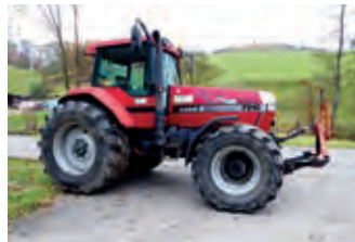
3162178 Case IH Teile für Magnum

BJ 1997, 150 h, 24.400 CHF, Tel. +41 (0)79 2162975, josefvoegeli@hotmail.com, wurde umgebaut für Tractorpulling, Besichtigung möglich.