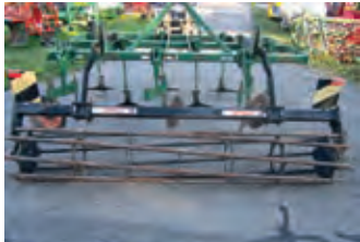
3159495 Althaus Taiga 260

3.800 CHF, Niederhauser Landmaschinen AG, Tel. +41 (0)62 9652020, niederhauser.landmaschinen@gmx.ch, Doppelherzschar, Flügelscharzinken, Stabwalzenkrümmer