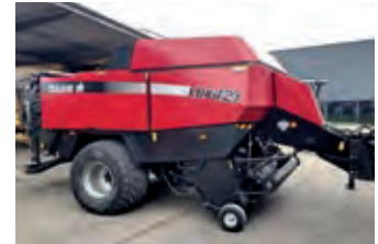
2253919 Case IH LBX 421R

1.508 CHF, Niederhauser Landmaschinen AG, Tel. +41 (0)62 9652020, niederhauser.landmaschinen@gmx.ch, Silohäcksler, Zapfwellenantrieb