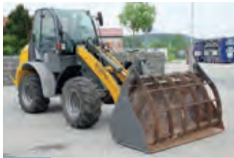
2468360 Kramer Allrad 1150

4.500 €, Ballenzähler, Wickelgerät mit Selbstladearm, Automatische Bedienung, 750 er Vorstreckler