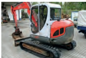
2127252 Neuson 8003 RD Midibagger

BJ 2006, 2350 h, 45.000 €, Grotmeier GmbH u. CO KG, Tel. +49 (0)5223 166-272, ugrotmeier@grotmeier.de, Seriennummer: B5304063