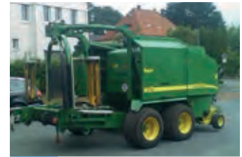
764291 John Deere 678

BJ 2002, 10.912 €, Ballenauswerfer, Elektronische Überwachung, Netzbindung, Schneidwerk