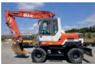
1933469 O&K Mobilbagger

BJ 2007, 17.000 €, Netzbindung, PickUp-Stützrad, Rotocut, Schneidwerk, Weitwinkel-Gelenkwelle