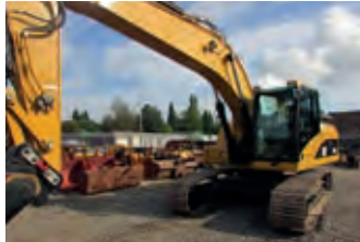
2424833 Caterpillar 323 DL

BJ 2014, 8 h, alga Nutzfahrzeug- und Baumaschinen GmbH, Tel. +49 (0)4282 570, service@alga.de, Reifen: 23,5 R 25, mit SCR Technology Tier