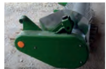
2233712 McHale PICK UP 5 R

BJ 2011, 22.000 €, Ballenauswerfer, Elektronische Überwachung, Netzbindung, PickUp-Stützrad