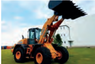
2469375 Case IH 921 F

D-33829 Borgholzhausen FON+49 (0)5425 5569 +49(0)1713182347 info@tobias-haessler.de