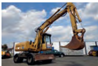
2457088 Zeppelin ZM 15 C

BJ 1997, 13615 h, 14.900 €, 1A-Truck GmbH, Tel. +49 (0)9367 988750, info@1a-truck.com, O&K MH-City PLH Mobilbagger