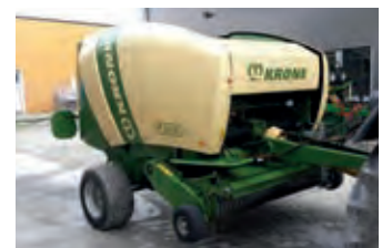
2385189 Krone Comprima 125 XC 750

BJ 2014, Druckluftbremse, Lenkachse, Serienmäßige Ausrüstung – Gerader Kasten mit Seiten aus Stahl und Polyethylen