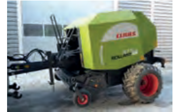
1889947 Claas 375 RC Rollant

BJ 2011, 29.500 €, Elektronische Überwachung, Netzbindung, PickUp-Stützrad, Rotocut