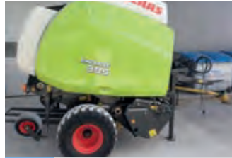
2116624 Claas Variant 385 RC

BJ 2006, 3720 h, Smitma B.V., Tel. +31 (0)77 3999840, sales@smitma.com, Engine Perkins 1104C-44 62 Kw, Erops cabin, Air conditioning, 4 x 4 x 4, 40