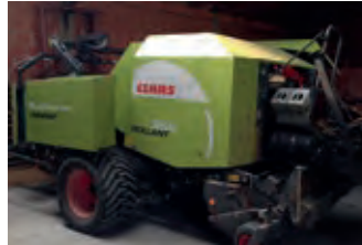
2461271 Claas 355 Uniwrap

BJ 2008, 4155 h, 77.500 €, Uwe Müller Baumaschinen GmbH & Co. KG, Tel. +49 (0)2403 9973-0, info@baumaschinen-mueller.de, GG. 23,5 t,