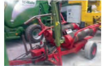
2435206 ELHO Ballenwickelgerät

BJ 2009, 19.111 €, Ballenauswerfer, Elektronische Überwachung, Netzbindung, Schneidwerk,