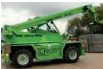
2287163 Merlo ROTO 33.16 KS

BJ 2003, Ballenauswerfer, Elektronische Überwachung, Netzbindung, PickUp-Stützrad, Schneidwerk