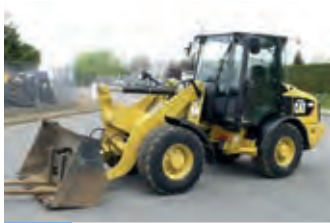
2465744 Caterpillar 906H

BJ 2013, 23.000 €, Elektronische Überwachung, Netzbindung, PickUp-Stützrad, Rotocut