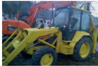
2401977 Massey Ferguson MF 50 HA

BJ 2006, 22.600 €, EGC-PARTS, Tel. +49 (0)8636 98640, egc@egcparts.de, Ausführung 347/02, Motor Deutz 2011, 79 PS