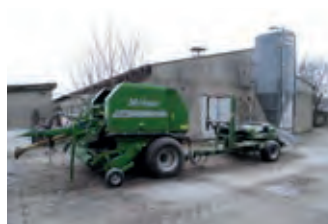
2433517 McHale F 550 15 Messer

BJ 1994, 8634 h, 14.900 €, Hematyr Nutzfahrzeuge, Tel. +49 (0)6033 9285447, info@hematyr-nutzfahrzeuge.de, Zeppelin-Sennebogen ZM 15 C Mobilbagger