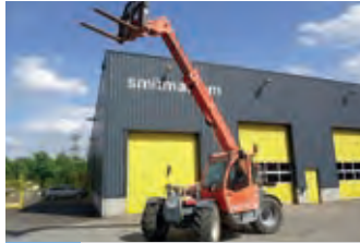
2466635 JLG 3509

BJ 2008, 2188 h, 27.000 €, STRIMAK Baumaschinen & Kfz GmbH, Tel. +49 (0)4542 822960, info@strimak.de, Schaufel mit Zähnen 0,9 m 3 , Palettengabel