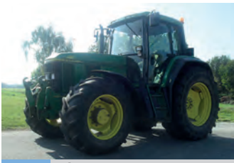
2317024 John Deere 6900

BJ 2012, 1580 h, 50 km/h 95.000 € exkl, Bulla Landtechnik GmbH, Tel. +43(0)676845065500, p.grammer@bulla-landtechnik.at, FH, FZW, DLA Auto Trac Ready, EHR, Klima