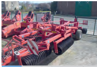
2421464 Kverneland 12,20m Walze

BJ 1997, 9050 h, 20.966 €, Raiffeisen Technik Nord-West GmbH, Tel. +49 (0) 49 41 9793-10, karl-heinz.niebuhr@technik-nordwest.de, Fronthubwerk, Klimaanlage