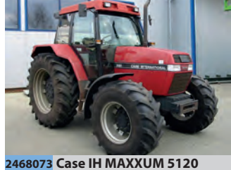
2468073 Case IH MAXXUM 5120

BJ 2007, 4.900 €, Uwe Bollhorst Landmaschinen, Tel. +49 (0)2751 7137, uwe.bollhorst@t-online.de, optisch und technisch guter Zustand