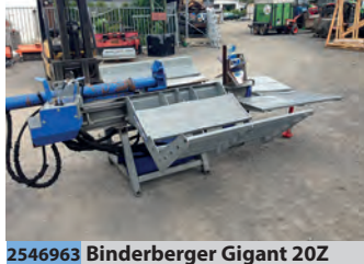
2546963 Binderberger Gigant 20Z

BJ 1998, 3.782 €, Heinrich Schröder Landmaschinen KG, Tel. +49 (0)4431 8907-22, info@schroeder-gruppe.de, mechanisch klappbar