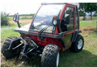
2521206 Reform H 4

BJ 2011, 11.500 €, Fricke Landtechnik GmbH, Tel. +49 (0)3998 27290, inga.juergens@fricke.de, Behälterabdeckung, Beleuchtung, Grenzstreueinrichtung