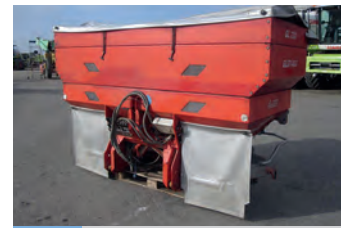
2413931 Rauch Axera EMC

BJ 2010, 34.000 €, Bioenergie Hövels, Tel. +49 (0)5976 456, karl.hoevens@t-online.de, Präzi Gewogener Doppeltrög mit Schneckenbaum, 2Trögschnecken 4,9m