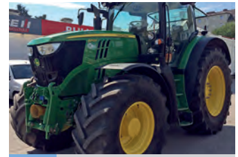
2562372 John Deere 6210R AutoPower