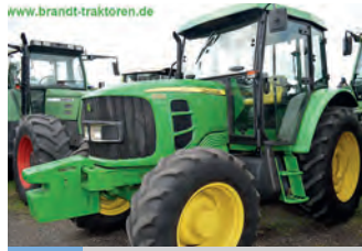
2511583 John Deere 6130

BJ 1996, 5.800 €, Heinrich Schröder Landmaschinen KG, Tel. +49 (0)4431 8907-22, info@schroeder-gruppe.de, ID: PENG701462 Gewicht 1.600 kg, ohne Gelenkwelle