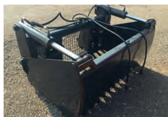
2441391 Stoll Schneidzange

1.597 €, BayWa GMZ Schönau, Tel. +49 (0)8065 90919-81, georg.lunghammer@baywa.de, mit Gelenkwelle