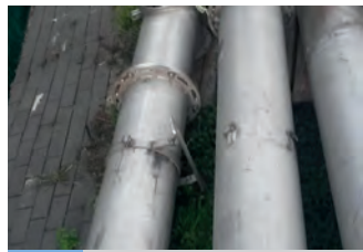
2375679 Präzi Doppeltrög

31.933 €, Tel. +49 (0)4409 781, EZ. 2012, 15 to., 40 kmh, Dosierwalzen, Deichselstoßdämpfer, 620/40 R 22,5, Top Zustand