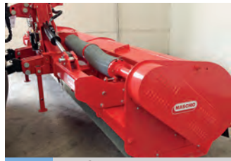
2573263 Maschio GEMELLA 470

19.000 €, Farmerservice Füllung, Tel. +49 (0)171 9979818, farmerservice@gmx.de, Walze mit 12,20 AB, deutscher Hersteller, Spährogussringe, Wellen alles Cromo 42