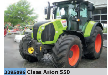
2295096 Claas Arion 550

BJ 1993, 9062 h, 12.941 €, Hildebrandt GmbH & Co. KG, Tel. +49 (0)4773 7991, info@hinrich-hildebrandt.de, Allrad, EHR, Kabine, Klimaanlage, Arbeitsscheinwerfer