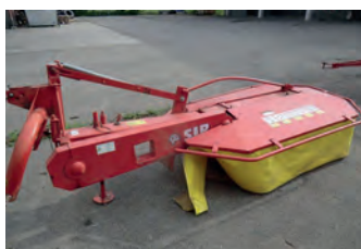
2508032 SIP ROTO 185

BJ 2006, aus 1. Hand, Klima, Allradlenkung, Zapfwellen, Netto 19.900 € Tel. +49 179-1372563 www.schaefer-landtechnik.de