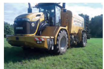
2525633 Terra Gator 3244

BJ 2013, 1.588 €, Hans Ayrlle Landtechnik, Tel. +49 (0)9074 1010, kontakt@hans-ayrle.de