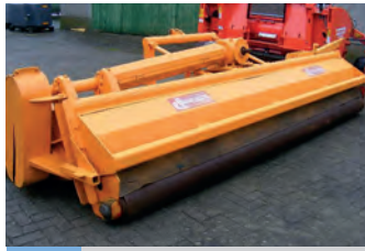
2167443 Dücker Uni Mäher UM 40

BJ 2014, 3.150 €, MS-Reifen & Räder Service, Reifen.Schmid@gmx.de, CONTI-CGS SVT Reifen 900/60R38 178D/181A8 - 178D = 7500 kg bei 65km/h - 181A8 = 8250kg bei 40km/h