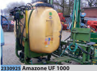
2330925 Amazone UF 1000

BJ 1998, 3.782 €, Heinrich Schröder Landmaschinen KG, Tel. +49 (0)4431 8907-22, info@schroeder-gruppe.de, mechanisch klappbar