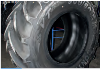
2386613 Continental 900/60R38 SVT