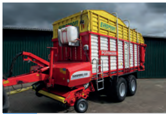
2539340 Pöttinger Europrofi 4500

Trac 800,40 km/h, BJ 1978, 8400 h, guter technischer zuverlässiger Zustand, 8800€, Tel. +49 (0)1708305639, bitte nach 20 Uhr melden