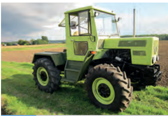
2576269 Mercedes-Benz MB Trac

BJ 2011, 390 h, 42.367 €, Ostermayr Landmaschinen, Tel. +49 (0)8783 96050, albin@ostermayr.com, Allrad, EHR, Fronthubwerk, Frontzapfwelle, Kabine