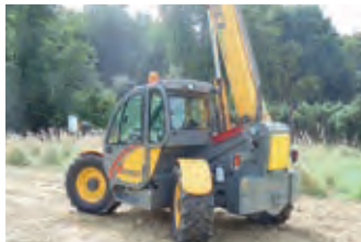
3079214 Dieci 37.7 Agri Zeus

BJ 2015, 338 h, 80.058 €, RWZ Rhein-Main eG, Tel. +49 (0)2652 936590, richard.puetz@rwz.de, Allrad, Frontzapfwelle, Gefederte Vorderachse, Anhängerkupplung