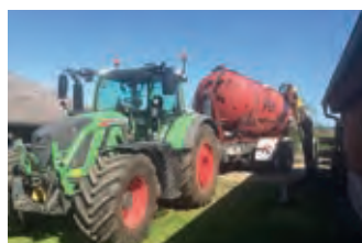
2930985 SAMSON Gt 18

BJ 2006, 36.134 €, Tel. +49 (0)7938 8753, biokollmar@arcor.de, Druckluftbremse, Silopresse, nur 3 Jahre im Einsatz. Ideal für Silomais