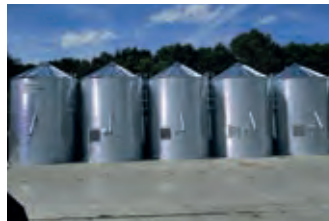
2543914 GS-75 Getreide-/Futtersilo

BJ 2010, 1950 h, 34.500 €, Landtechnik-Klein GmbH, Tel. +49 (0)2173 911348, landtechnik-klein@gmx.de, Kabine, Klima, Schnellwechselrahmen, Zugmaul