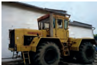
3010981 Kirovets K 701M

BJ 11/2013, ca. 2450 R.-std., mit Fahrwerk, langes Auswurfrohr, Leckmaterialsystem, hydr. Stützrolle, IBC, VARIO-Flex u.v.m. Besichtigung Tel: +49 (0)171 7729894