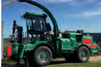
3034037 Albach DIAMANT 2000

BJ 2014, ca.2050 R.-std., selbstfahrender Holzhackler mit 70 Km/h, Zulassung für Autobahn, 450KW, 612 PS, Einzug 1230 x 980 mm, Besichtigung Tel: +49 (0)171 7729894