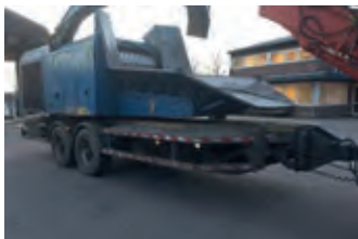
3034046 Jenz 581 DL

BJ 2012, 50.000 €, Tel. +49(0)64301648, haas-lohrheim@t-online.de, Beleuchtung, Bordcomputer, Einspülschleuse, Fahrwerk, Handwaschwasserbehälter, Vollaustattung