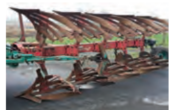
3079719 Kverneland LD 85

BJ 1996, 9.846 €, Tel. +49 (0)172 7943397, Ottmar-ramsauer@web.de, Druckluftbremse, Pendel-Bordwände, Plane, TÜV bis 2017. sofort einsatzbereit