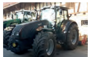
3062472 Valtra T163

BJ 1998, 1.990 €, Tel. +49 (0)5733 8718904, Beleuchtung und Warntafeln neu, sofort einsatzbereiter Zustand