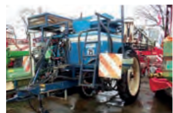
3079731 Sieger TSMR 2900

10.500 €, gebr., Tel. +49 (0)171 3887993, moritz-sander@web.de, Samson Fass mit Pumpe zum Saugen und Pumpe zum Ausbringen, auch geeignet für Lkw-Montage