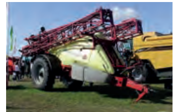
2894163 Hardi Commander 6600

BJ 2016 - aus geplatztem Auftrag, 3.000 € netto/Stck., Montage 450 €, SBB-Schlenga, Tel. +49 (0)335 86924447, sbb-ffo@web.de, 6 Flachboden-Stahlsilos verzinkt, 96 m 3