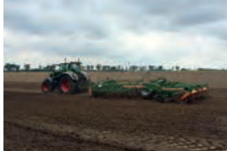
3079393 Amazone Centaur 5000

BJ 2014, ca.2050 R.-std., selbstfahrender Holzhackler mit 70 Km/h, Zulassung für Autobahn, 450KW, 612 PS, Einzug 1230 x 980 mm, Besichtigung Tel: +49 (0)171 7729894