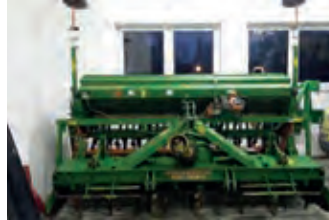
2878114 Amazone KE303&AD302

BJ 2002, 11.500 €, M-D Agrar KG, Tel. +49 (0)172 2087559, muellerdeelsen@gmx.de, Beleuchtung, Fahrwerk, Klappvorrichtung, Steinsicherung