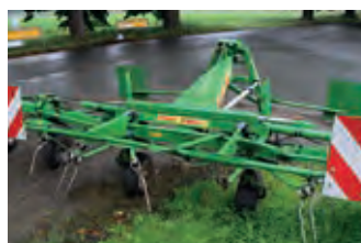
3035831 Stoll Z 685 pro

BJ 1990, 8900h, HU 05/18, 15900 €, Tel. +49 (0)162/9698286, holger.brunns1@web.de (26605), 40km/h, 18.4x38 (80%) u 14.9x26 (60%), 2DW,zus. Öltank 25 l, sehr gepflegt