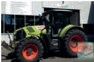
3079700 Claas Arion 650 Cmatic

BJ 2013, 2629 h, 71.000 €, TECHNIKA, Tel. +49 (0)177 6466244, lk70@gmx.de, Allrad, Druckluftbremsanlage, EHR, Fronthubwerk, Frontzapfwelle