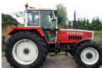
2997146 Steyr 8110 SK 2

BJ 1999, 23.246 €, Gospodarstwo Rolne, Telefon +48 (0)501 104 248, techniktraktor@tlen.pl, guter Zustand, Zusatzgewicht, Ölbrenner Riello RL 100