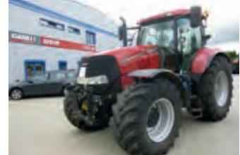
3079203 Case PUMA 230 CVX

8.856 €, Meents Landwirtschaft, Tel. +49 (0)4973 404, u.meents@web.de, Beleuchtung, Exaktstriegel, Fahrgassenschaltung, Nachlaufwalze, Schleppschare